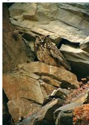
Hibou grand duc- R. DUMOULIN

L'oiseau qui m'inspire le plus d'émotion, c'est le Grand duc. Son cri sauvage déchire le silence de la nuit. Il est là, posé sur un rocher, presque à hauteur d'homme. Il est le super prédateur du site qu'il inspecte de son vol lent, ample et silencieux. Il ne dédaigne aucune proie et ne craint pas de s'en prendre à un jeune renard ou même au pèlerin. Je le soupçonne de s'attaquer aux jeunes chèvres du troupeau, mais je n'en n'ai pas encore la preuve.