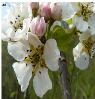
Poirier sauvage J.M. DARCIS

Au sommet de la falaise, un sol maigre et sec accueille le Chêne sessile. Les Erables, les Frênes, les Ormes de montagne et les Tilleuls colonisent les ravins pentus. La floraison du Poirier sauvage est un bijou au printemps. En automne, vous apprécierez les couleurs fauves de l'Alisier torminal. C'est dans le vallon frais et ombragé à l'entrée de la réserve, du côté de Sougné que vous goûterez le mieux l'ambiance forestière. Au printemps, vous ne manquerez pas d'admirer la floraison très précoce des Orchis mâles.