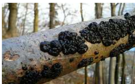
Exidie glanduleuse J.M. DARCIS

A l'automne, de superbes champignons recyclent le bois mort.