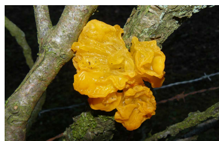
Tremelle mésenterique J.M. DARCIS

En été, peut-être le Grand mars changeant quittera-t-il la canopée quelques instants pour s'offrir à votre regard.