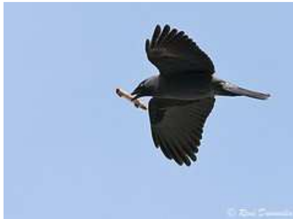
Choucas des tours

Les Choucas des tours jouent à se poursuivre et rivalisent d'acrobatie en poussant leur petit cri sec.