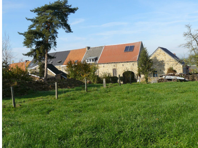
Village de Sur-la-heid