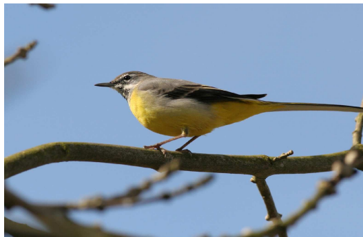
Bergeronnette des ruisseaux

La Bergeronnette grise et la Bergeronnette des ruisseaux volent en ondulant d'une pierre à l'autre.