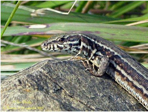
Lézard des murailles

Dans les éboulis, le Lézard des murailles se chauffe au soleil. Il détale devant votre semelle. Il vous faudra davantage de chance pour apercevoir son prédateur, la Couleuvre lisse.