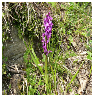
Orchis mâle J.M. DARCIS