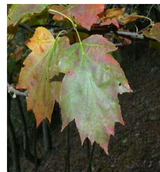
Sorbier torminal J.M. DARCIS

A l'automne, de superbes champignons recyclent le bois mort.