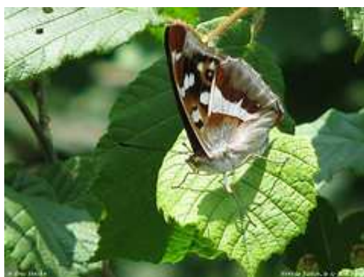
Grand mars changeant

En été, peut-être le Grand mars changeant quittera-t-il la canopée quelques instants pour s'offrir à votre regard.